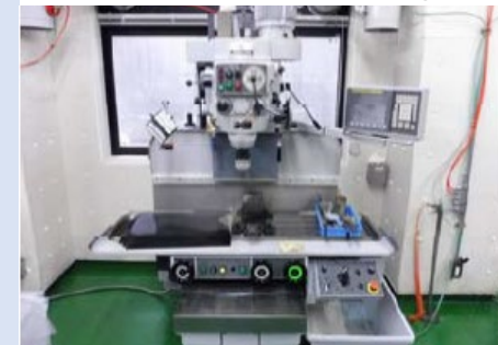
拠点の研究設備・機器の紹介