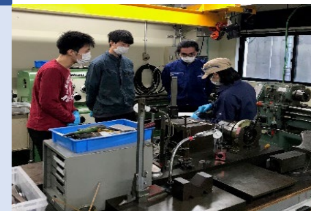
利用方法の説明（安全実習）